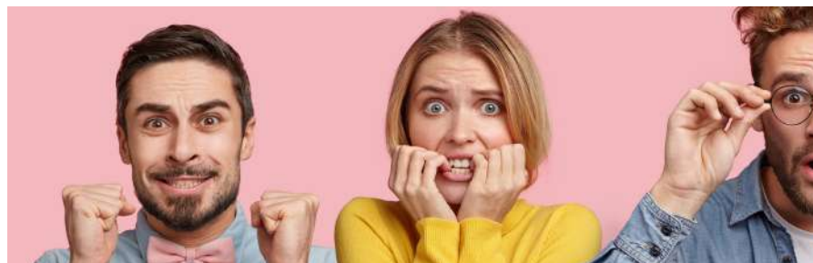
Dando permiso a mis emociones GRUPO DE TRABAJO SOBRE INTELIGENCIA EMOCIONAL