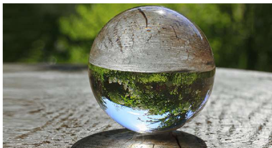
CON-VIVIENDO-CON EL DOLOR Y LA ENFERMEDAD CRÓNICA Con Olga Cuesta

Marzo 2022 · Mayo 2022 (Inicio 9 de marzo) 6 talleres · Miércoles quincenales de 17'30 a 20'30h Precio: 180€